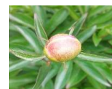
Bild: Pfingstrose, Pfarrgarten